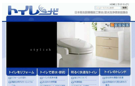
「リニューアル画面(イメージ)」

11月10日(日本トイレ協会制定)に、日本衛生設備機器工業会および温水洗浄便座協議会のホームページが全面リニューアルします。名称も「サニタリーネット」から「トイレナビ」に変更。さらに内容も充実させました。是非ご覧ください。